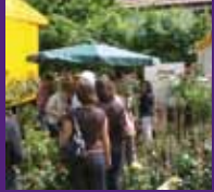
Impressionen vom Rosenfest 2008